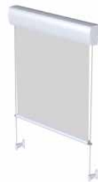
FM 103/203 Seilführung