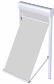
FM 102/202 Schienenführung, mit Ausfalleinheit