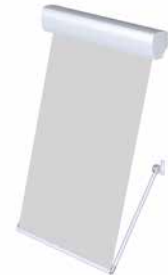
FM 105/205 Fallarmmarkise